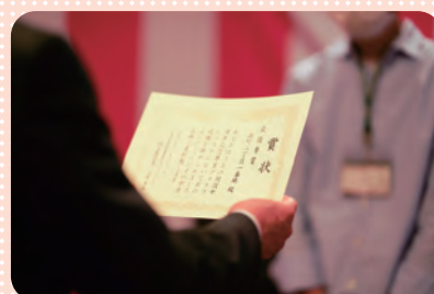
ユニット選抜 フォトコンテスト

「祝うたの10周年〜温故知新〜 老いも若きも共に生きる!!」 令和3年12月21日、うたのが10周年を迎えるに当たってのキャッチフレーズを職員応募によるコンクールで決定し、うたの開設日に合わせて10周年記念式典と感謝の会（イベント）を開催いたしました。 コロナ禍であったため、ご利用者家族の出席は自粛しましたが、家族会代表をはじめ、地域包括支援センター・地域の各種団体・自治会連合会会長にもご出席いただき、うたの10周年の功労者として皆さまに感謝状をお渡ししました。また、式典では、うたの開設からの歩みを映像と共に紹介。うたの永年勤続職員の表彰・記念リーフレットの作成・ご利用者によるお祝いのピアノ演奏・フォト（写真）コンテスト・ご利用者への記念品贈呈（近隣幼稚園園児作成）を行いました。式典後には、ご利用者も職員も皆で楽しく、周年を祝えるイベントとして、のど自慢大会・居酒屋などを行いました。