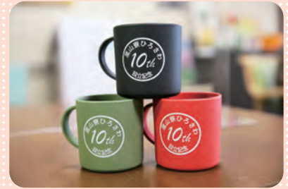
記念品 介護スタッフデザインのコップ