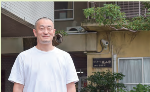
地域活動委員会 委員長