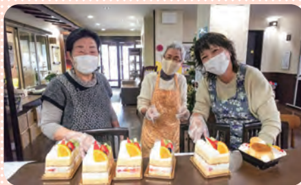
記念喫茶 ひろさわ入所者家族の会の皆さま