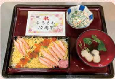
カニちらし 松茸麩のお吸い物