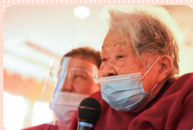
のど自慢大会♪ 感染対策をして