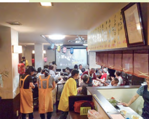
2017年7月 ひろさわカラオケ居酒屋（コロナ前）

地域の皆さまやご利用者が、安心して暮らせる街づくり・共に暮らせる街づくりの一助を担っていけるよう努めてまいります。