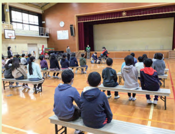
2021年12月 宇多野小学校 車いす体験