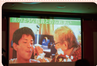
スライド上映 開設からの歩み