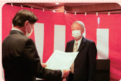
功労者表彰 (右) 自治会連合会 折居会長