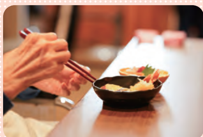
居酒屋 天ぶら・お造り・ケーキなど