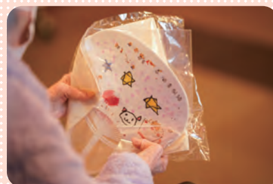
記念品 幼稚園の園児さん手づくり