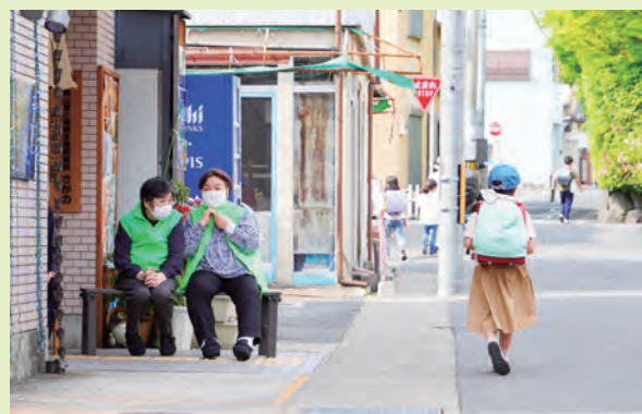
2022年5月 さがの 子ども見守り隊

かな生活につながっていたと感じています。 嵐山寮ではコロナ禍においても、感染対策を徹底したうえで、今できる取組み、今しかできない取組みを考え、地域の皆さまとご利用者・施設との関係性が途切れないよう、各拠点での地域清掃活動・児童館での認知症理解のための寸劇の披露・近隣幼稚園へ七夕飾りの笹を届ける園児との交流・通学路で「子ども見守り隊」として帰宅する子どもへの挨拶運動など、施設の中にとどまらない活動を、ご利用者と一緒に取り組んでおります。また、地域の魅力を発信するためSNS（ソーシャルネット