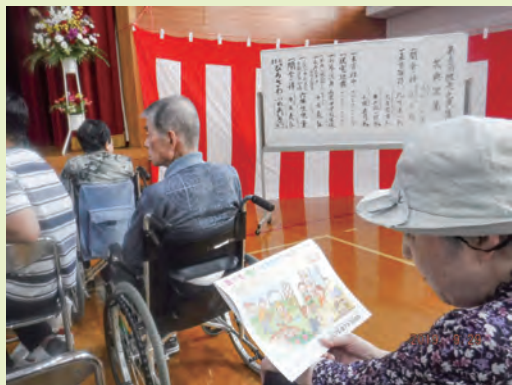
2019年9月 広沢学区 区民の集い（コロナ前）

かな生活につながっていたと感じています。 嵐山寮ではコロナ禍においても、感染対策を徹底したうえで、今できる取組み、今しかできない取組みを考え、地域の皆さまとご利用者・施設との関係性が途切れないよう、各拠点での地域清掃活動・児童館での認知症理解のための寸劇の披露・近隣幼稚園へ七夕飾りの笹を届ける園児との交流・通学路で「子ども見守り隊」として帰宅する子どもへの挨拶運動など、施設の中にとどまらない活動を、ご利用者と一緒に取り組んでおります。また、地域の魅力を発信するためSNS（ソーシャルネット