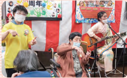
故郷 (ふるさと) を手話付きで合唱しました♪