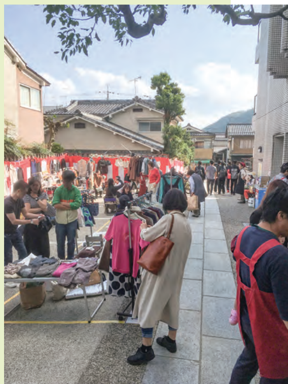
2019年10月 モギ店（コロナ前）

さて、嵐山寮における一番大きなイベントはモギ店です。2019年までは毎年10月に開催し、お寿司におでん・焼きそば等々のモギ店やフリーマーケットを出店していただき、法人のサービスをご利用いただいているご利用者やご家族はもとより、たくさんの地域の皆