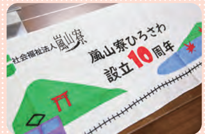
記念品 介護スタッフデザインのタオル

令和3年11月16日、ひろさわが10周年を迎えました。感染予防のため参加人数を制限しましたが、皆さまに「特別感」を味わってもらえるような催しをと考え、記念式典・演奏会・記念イベントを開催しました。 また、10周年をデザインした記念品を制作、普段使いに最適なコップと、広沢池の風景や愛宕山をイメージしたフェイスタオルを贈りました。演奏会では、感染予防のため大きな声での歌はひかえ、手話や体操を取り入れながら実施、式典当日までにご利用者と一緒に練習しステージに出て披露するなど、一体感のあるイベントとなりました。式典・イベントへは、ご利用者家族の会の役員の皆さまにも参列いただき、会長からお祝いのお言葉を頂戴し、記念品としてご家族の面会時に使用できるスリッパと、施設での様子を撮影してお伝えできるように一眼レフカメラを寄贈していただきました。