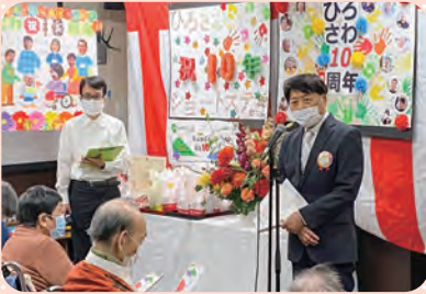
山岸総合施設長挨拶 壁飾りのまえて